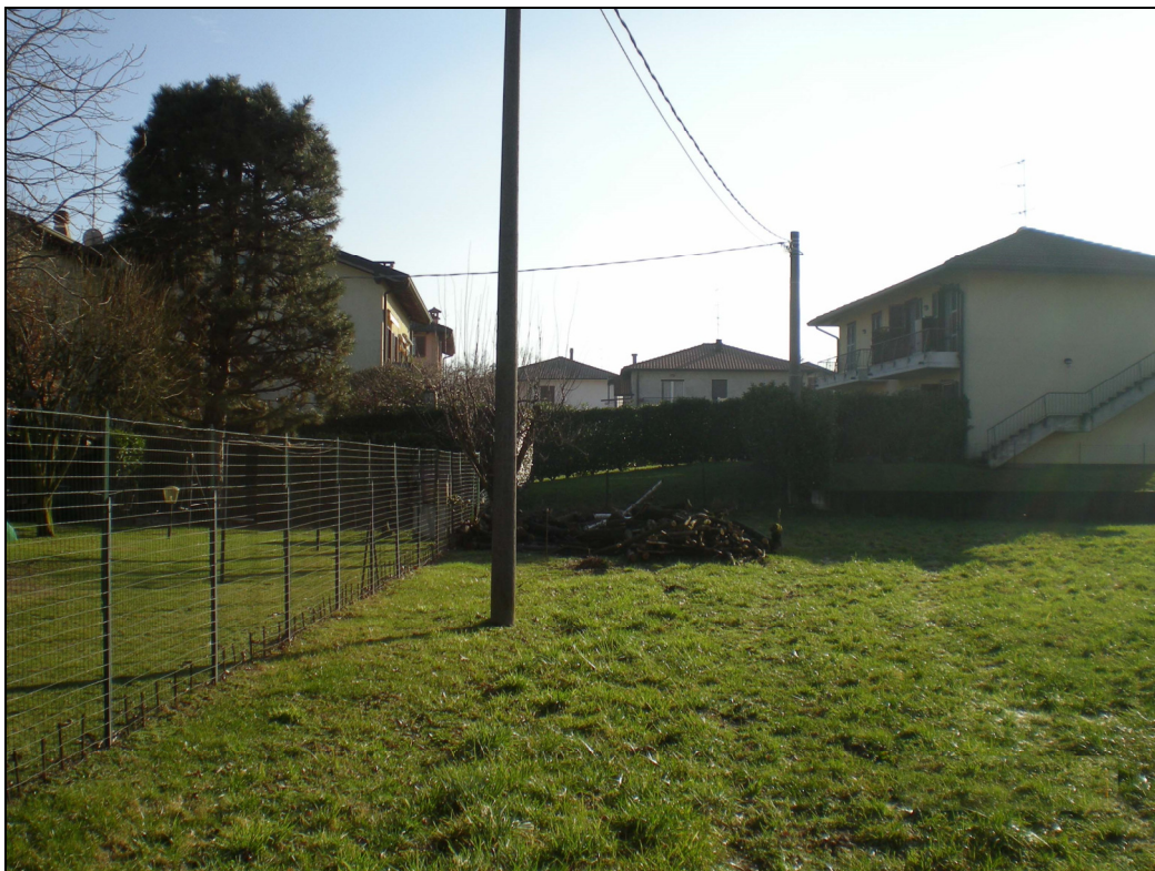
Punto di ripresa n.3