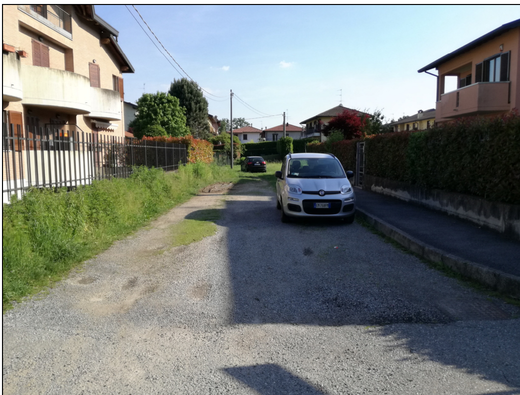
Punto di ripresa n.2