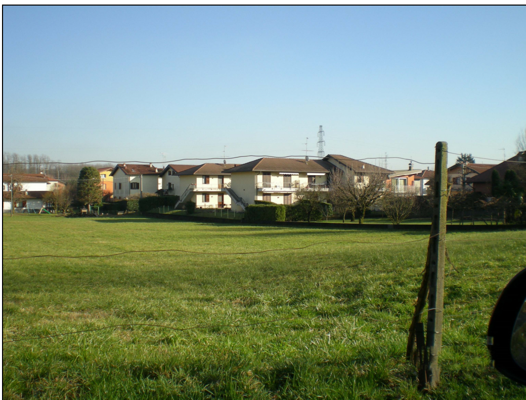
Punto di ripresa n.14