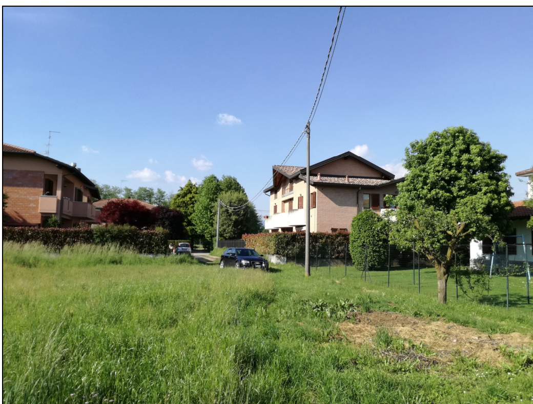
Punto di ripresa n.6