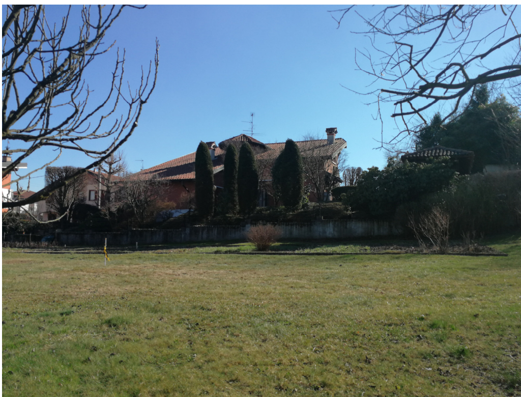
Punto di ripresa n.12