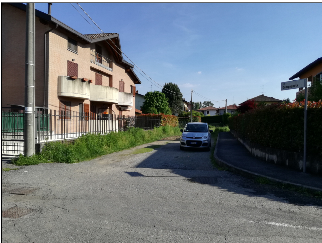
Punto di ripresa n.1 – imbocco via Campagnola