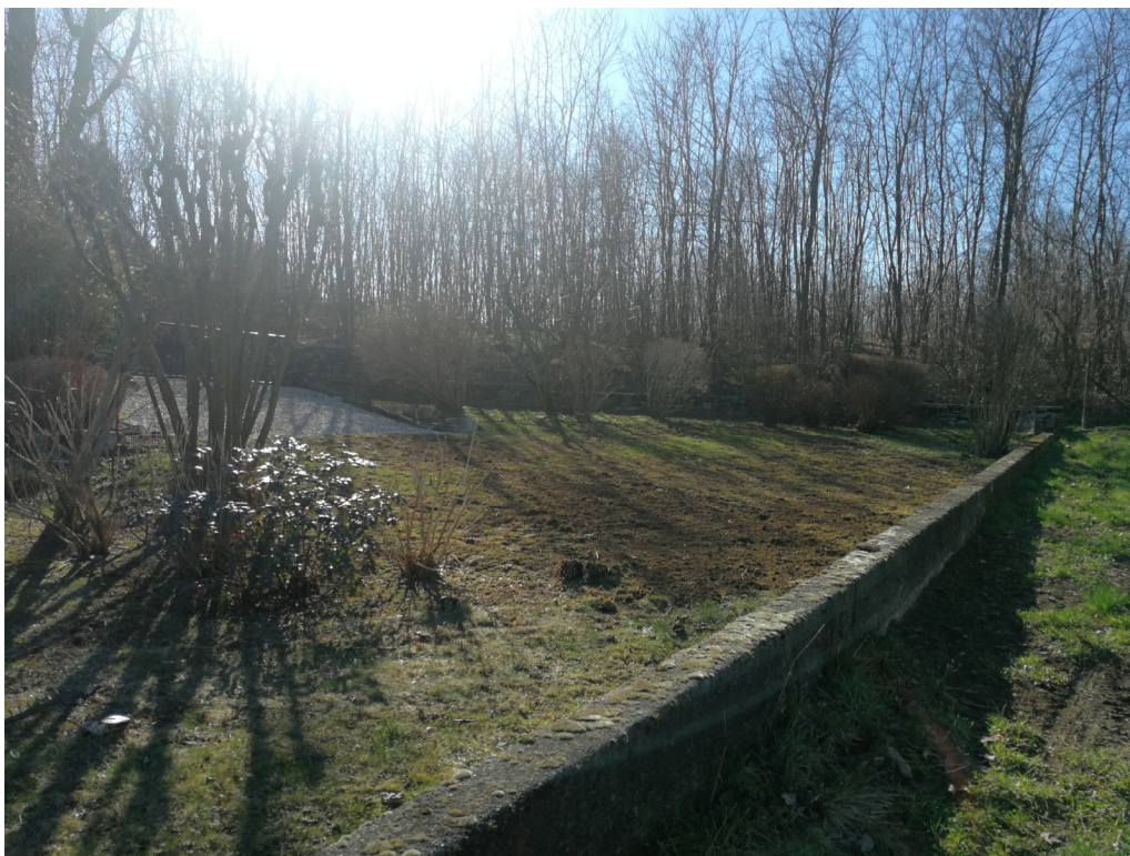
Punto di ripresa n.13