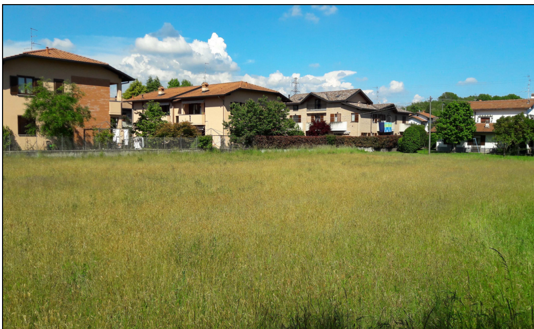
Punto di ripresa n.10