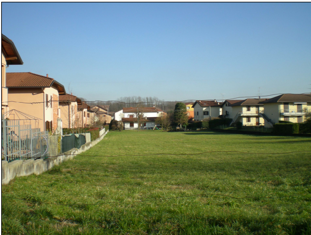
Punto di ripresa n.15