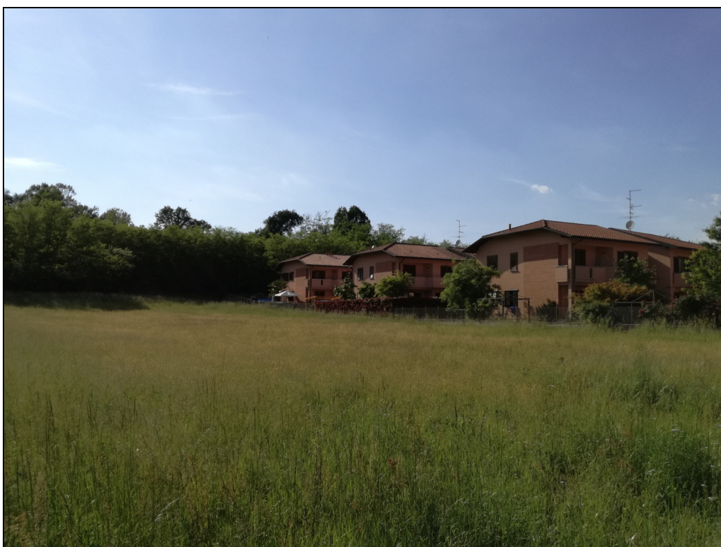
Punto di ripresa n.8