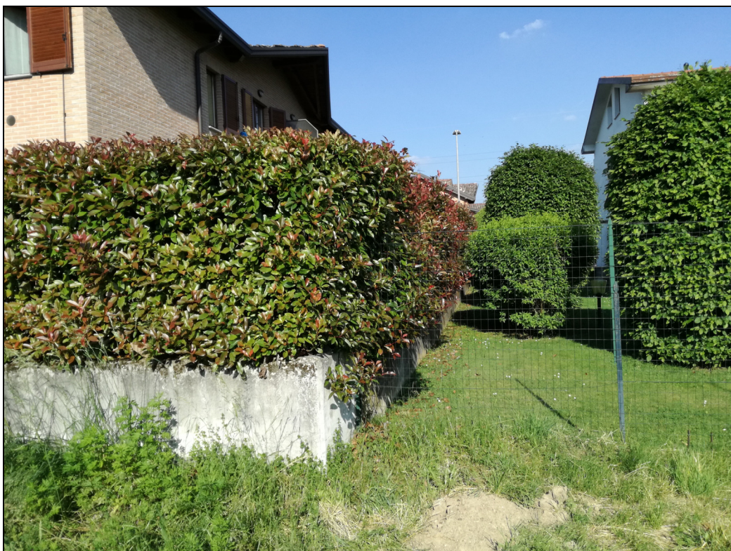
Punto di ripresa n.5