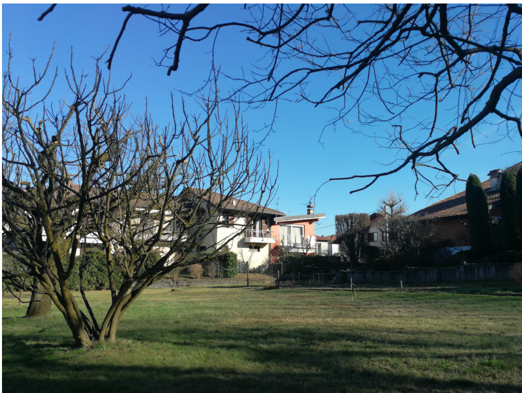
Punto di ripresa n.11