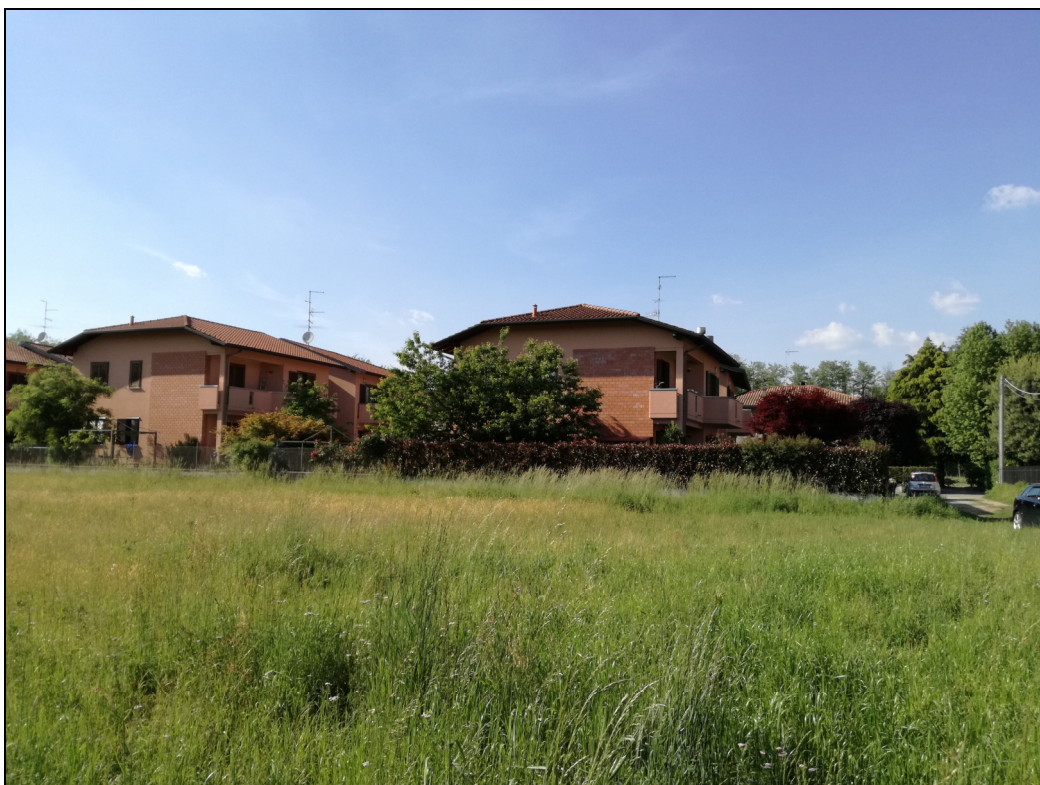
Punto di ripresa n.7