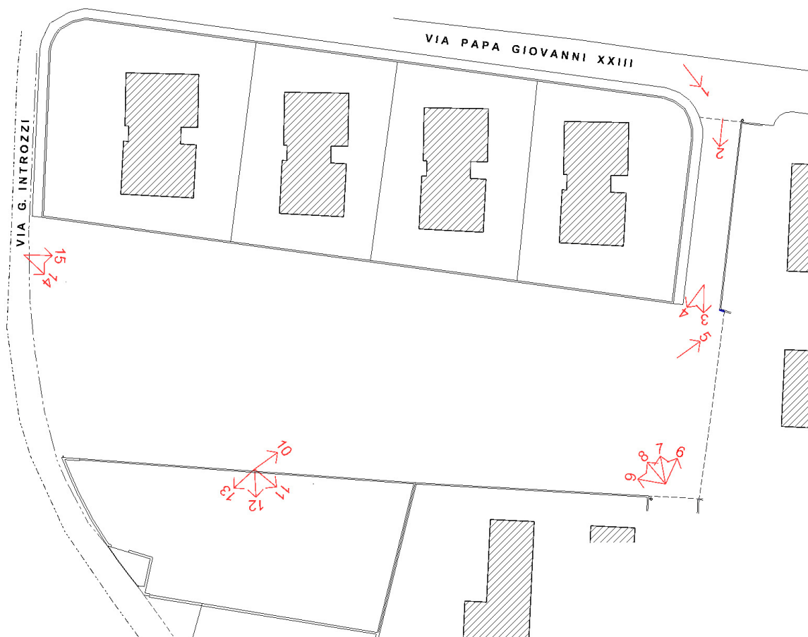
Schema dei punti di vista delle riprese fotografiche