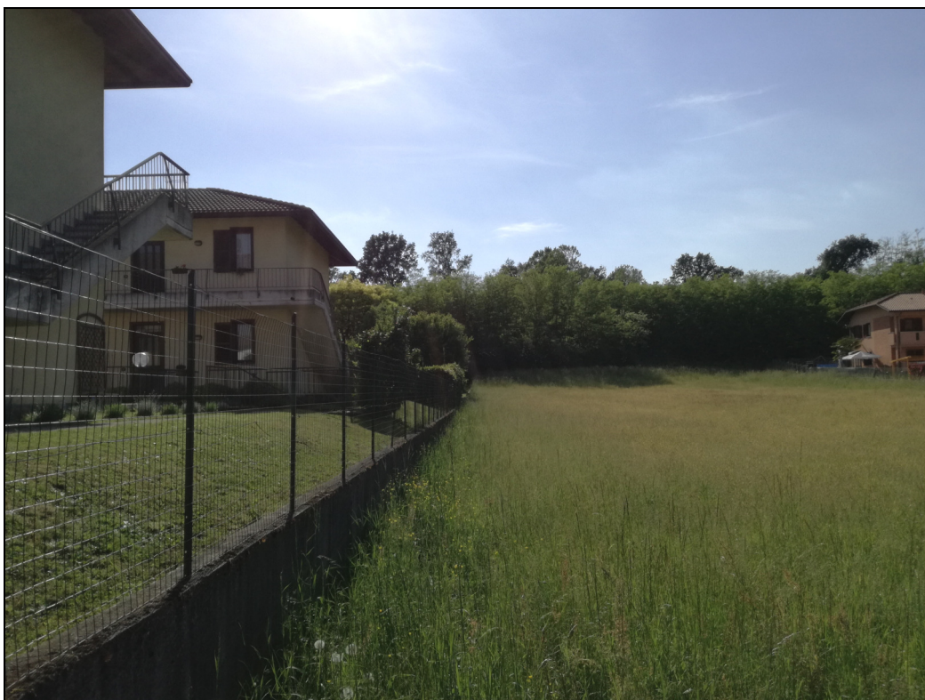
Punto di ripresa n.9