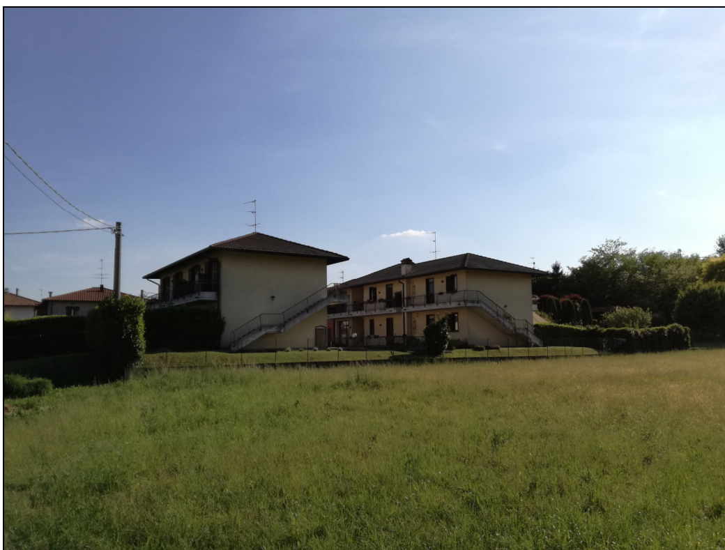
Punto di ripresa n.4